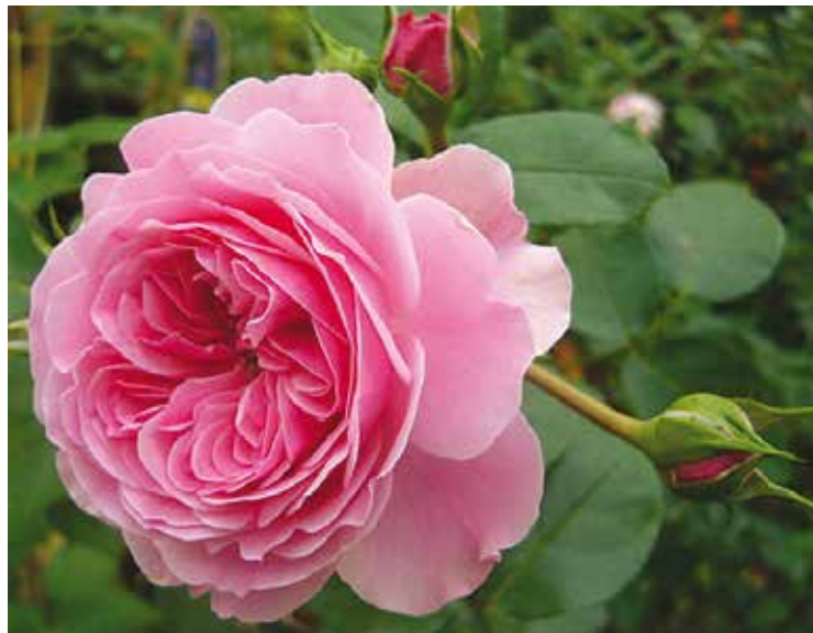
R. 'Anton Tsjechov', grootbloemige roos, Meilland 2009

Verder een centifoliaroos 'Centfeuilles Descemet', een albaroos 'Chloris', een Portlandroos 'Jeune Henry' en een pimpinellifoliaroos 'La Grande Pimprenelle aux cent écus'. In Sangerhausen zag ik in 2013 ook nog R. 'Fanny Bias' die volgens het naambordje ook een gallicaroot is van Descemet van voor 1811.