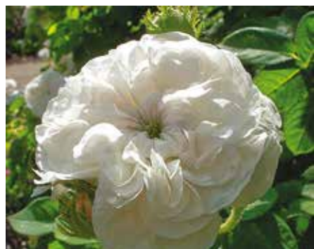
R. 'Mme. Hardy', damascener, Hardy 1831

Sutter vond op zijn grond in 1848 goud maar heeft er zelf niet van kunnen profiteren omdat goudzoekers en rovers hem alles afpakten en omdat de zoektocht naar goud zijn grondstuk totaal verwoestte.