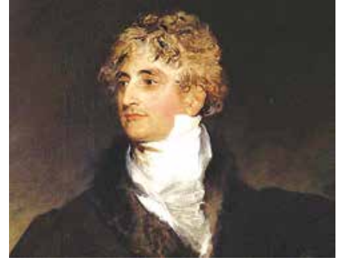
Hertog de Richelieu, gouverneur van De Krim