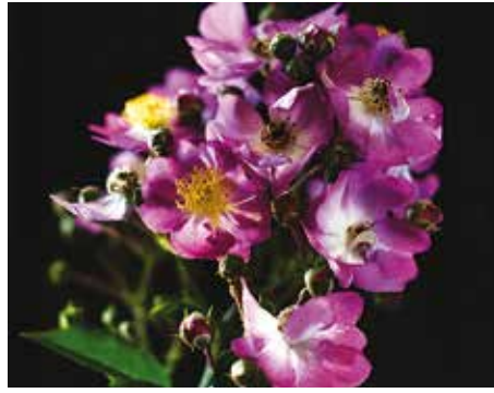
Winnaar van de geurprijs nr. 362-64 van Raphael Roses, Nieuw-Zeeland