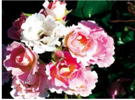
Afd. A, trosroos certificaat 1 e klasse, R. 'KO 07/2102-01', Kordes D