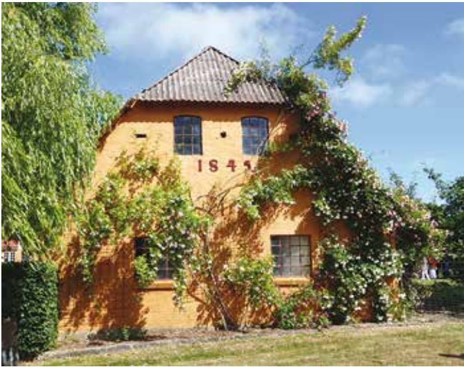
Foto 18. Boerderij Trappendal