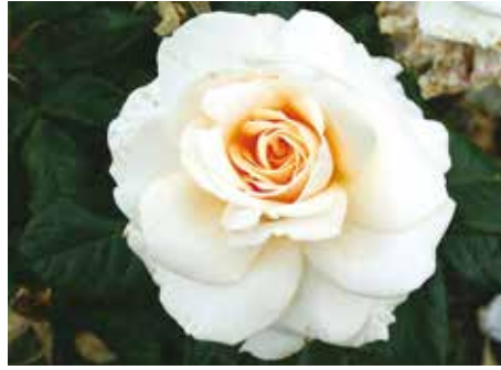
Afd. C, grootbloemige roos goud, R. Pride and Prejudice ('HARwindows'), Harkness UK