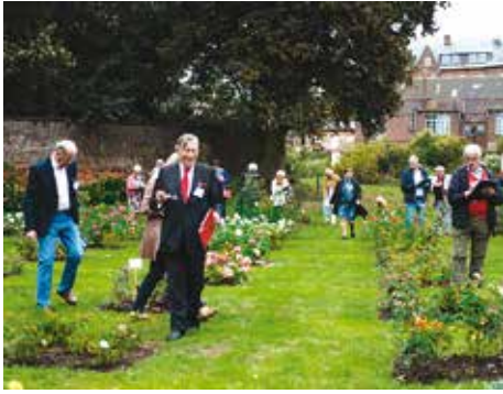
De jury is enthousiast bezig