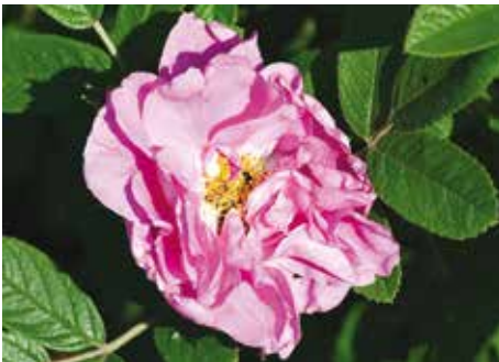
Afd. A, heesterroos goud, R. 'r-09-0078-002', Boot & De Ruiter NL