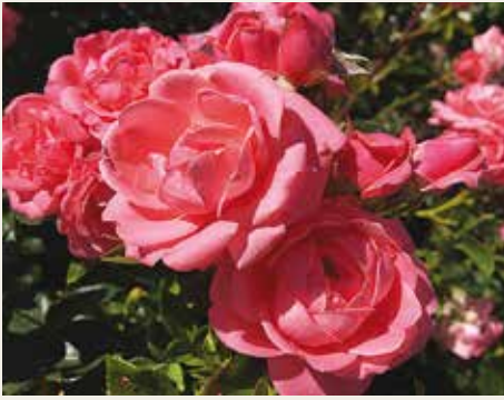
Gerlev Parken; R. Boogie Woogie ('POUlyc006')

Voor de lunch had men voor een modern tuincentrum gekozen waar we in groepen een in Denemarken zeer geliefde hotdog mochten afhalen. Dat was bijzonder / anders, zo maak je van alles mee. We eindigden de dagtrip in Gerlev Parken, een in natuurlijke stijl aangelegd park, eigenlijk een arboretum, met veel rozen: een grote collectie Poulsen rozen, zoals R. Bright Cover ('POUItw003') en R. Boogie Woogie ('POUlyc006'), Valdemar Petersen rozen, en oude rozen zoals R. 'Blush Rambler'. Dit was echt genieten. We werden ontvangen door de 'Friends of the Garden' die de tuin onderhouden en tevens bij dit bezoek zorgden voor drinken en sandwiches. De avond werd weer ingenomen door twee vergaderingen, waarvan een gecombineerde vergadering van de rozenveredelaars en de internationale rozenkeuringen. Deze vergadering was voor mij belangrijk, waarover later meer.