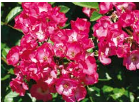
Afd. A, heesterroos certificaat 2 e klasse, R. 'r-09-0122-011', Boot & De Ruiter NL