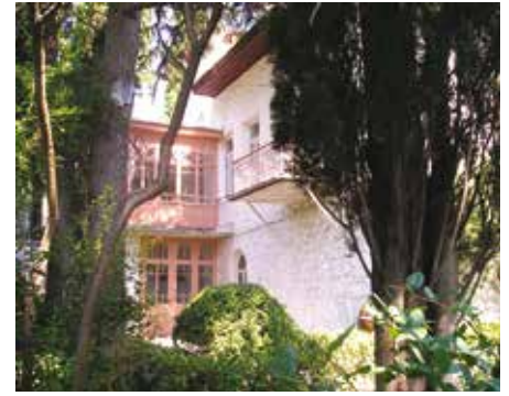
De 'Belaya datsja' is nu het Tjsechov museum