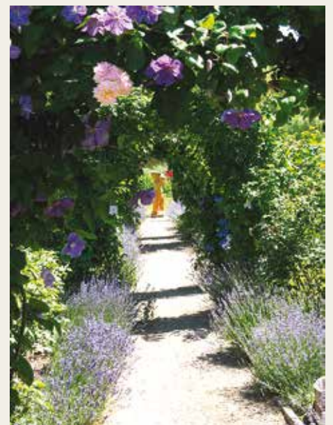
Doorkijkje in de tuin 'Kornerupgaard'