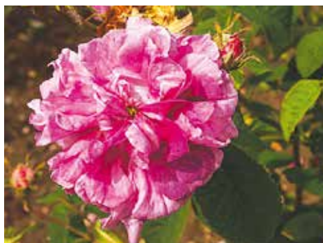
R. 'Oeillet Flamand', gallica, Vibert 1845