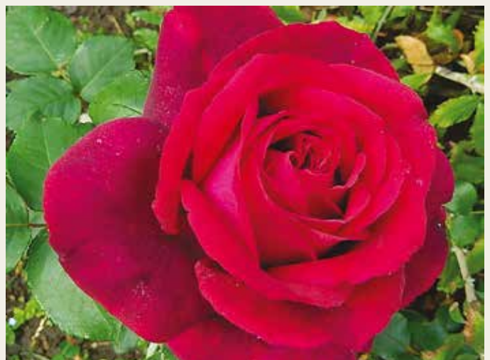
Geurprijs: R. Gräfin Diana ('KORdiagraf'), grootbloemige roos, Kordes D