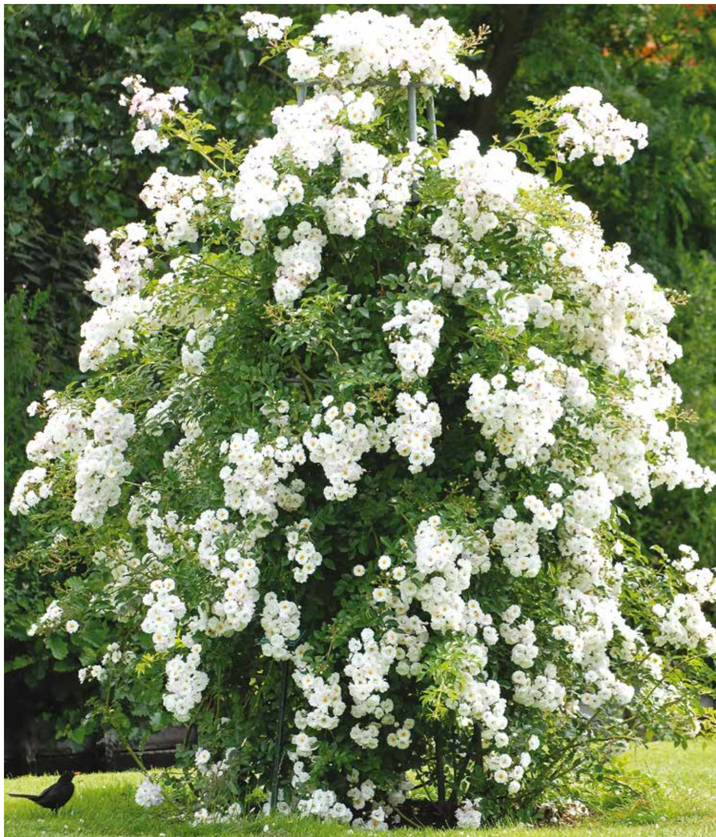
Gouden Roos van Den Haag 2018: R. 'Groei & Bloei', Marco Braun NL

Periodieke uitgave van de Nederlandse Rozenvereniging