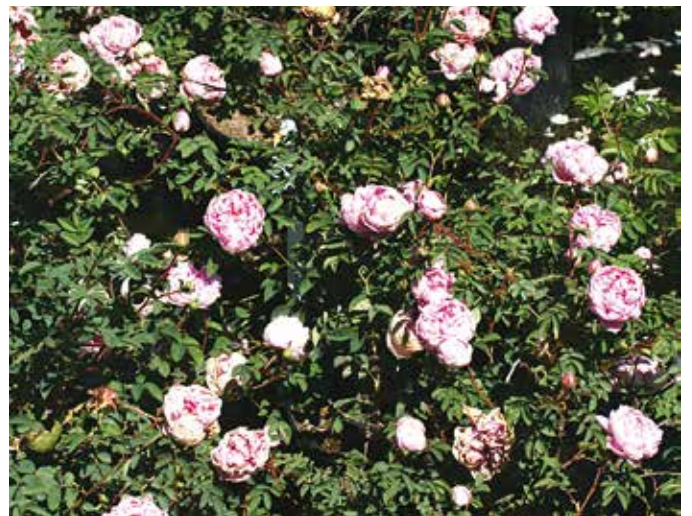
Deze roos heeft de strenge selectie niet doorstaan