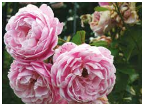
Afd. C, leiroos zilver, R. Cupcake ('MATcisa'), Matthews Nieuw-Zeeland