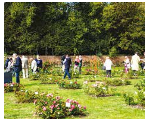
Jurering van de rozen