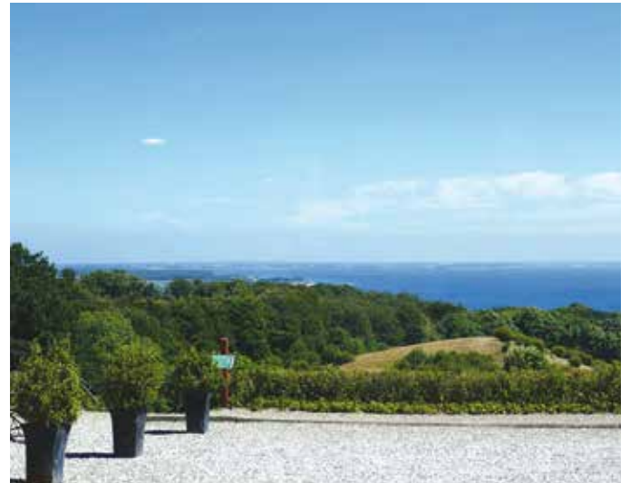
Foto 19. Uitzicht vanaf Skammelingsbanken

eveneens witte kassen, waar je doorheen kon lopen. Hoewel er zeker ook mooie plantcombinaties te zien waren, was het moeilijk om een goed overzicht van deze tuin te krijgen. Het werd tijd voor de terugreis naar Kopenhagen. De bus reed naar de ferry, waarop wij gedurende de overtocht ook de lunch gebruikten. Daarna nog een rit terug naar het Tivoli Congresscentrum van waar een ieder zijn eigen weg ging. Een einde aan een intense, maar prachtige ontdekkingsstocht door Denemarken!