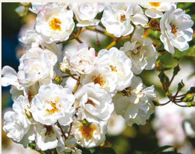
Gouden Roos: R. 'Groeï & Bloei', leiroos, Marco Braun NL