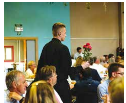
Het tonen van de prijswinnende rozen