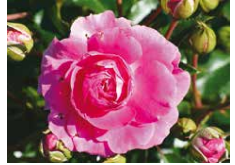
Afd. A, trosroos certificaat 2 e klasse, R. 'RT 11771', Tantau D