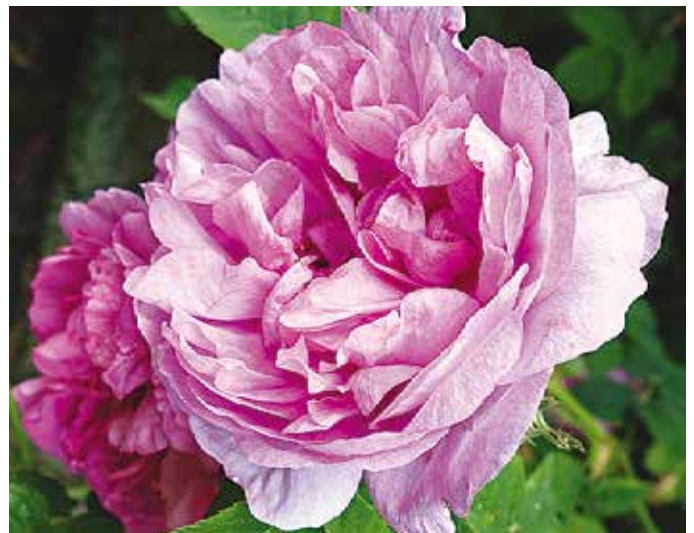
R. 'Impératrice Joséphine', gallica, Descemet, vóór 1815