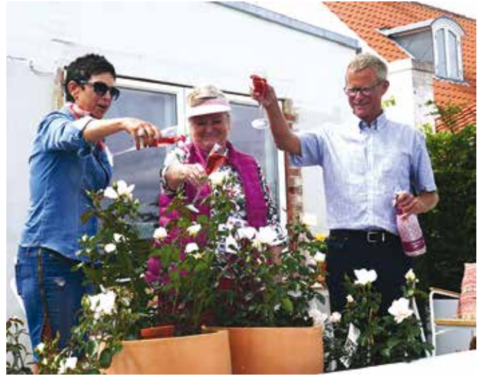
Foto 4. Rozendoop R. 'Inger Forever'