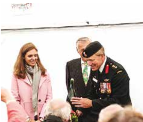
Doop van de roos 'George Lawrence Price'