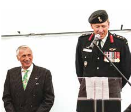
Speech door de Canadese kolonel