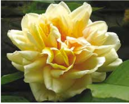
R. 'Maréchal Niel', Noisetteroos, Pradel vóór 1864