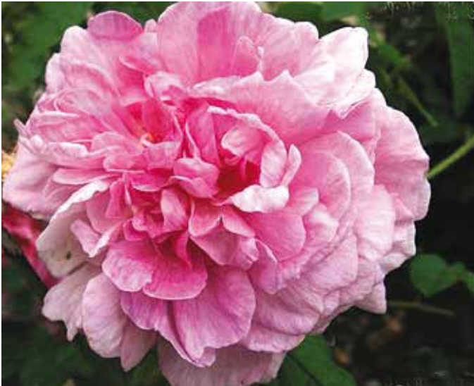
R. 'Belle Hélène', gallica, Descemet, vóór 1815