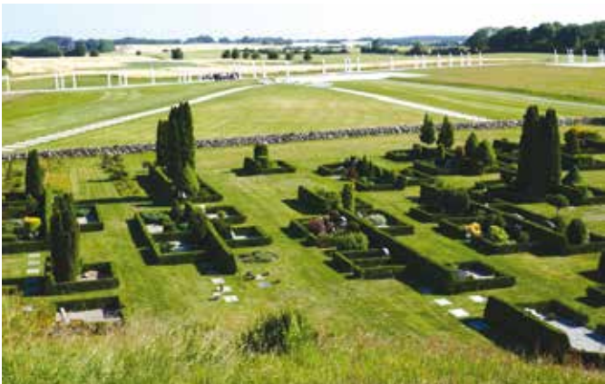
Foto 20. UNESCO site Jelling

eigenaren zijn ruimschoots aan bod gekomen. Denemarken is bovendien een prettig land om doorheen te reizen, schoon, ruimtelijk en dun bevolkt. Een land om misschien nog eens naar terug te keren met Nederlandse rozenliefhebbers?