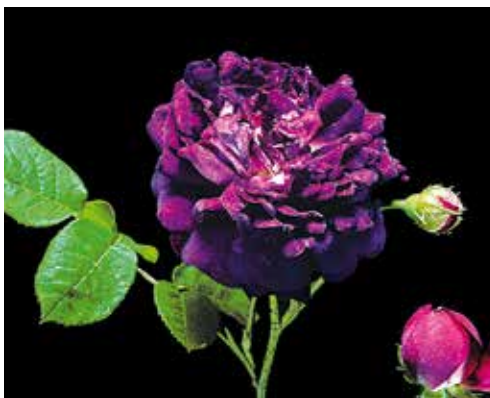
R. 'Cardinal de Richelieu', gallica, Parmentier vóór 1847