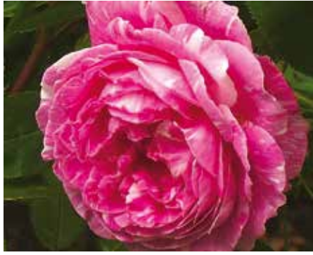
R. 'Vick's Caprice', remontanthybride, Vick 1891