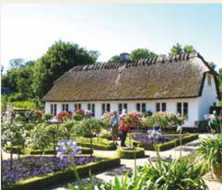
Queen Louise's Rose garden