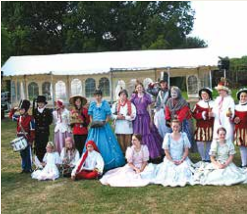
Valby Park, optreden van een jeugdgroep met de sprookjes van H. C. Andersen

teel problemen zijn, waardoor de registratie vertraagd wordt. Bij de registratie wordt de door de veredelaar gekozen naam voor de roos vastgelegd in het register, waardoor de naam beschermd is en net als bij muziek er over een bepaalde periode rechten voor gevraagd kunnen worden.