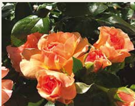
R. 'Prins Henrik', Eskelund, werd ook gedoopt in Fredensborg