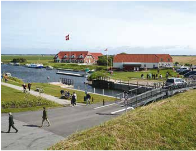
Foto 14. Kammerlussens, Nationaal Park Waddenzee

Wat een uitzicht! (foto 19) Het restaurant serveerde ons een heerlijke lunch. De middag werd besteed aan een bezoek van het museum van Koldinghus , gevestigd in het laatste koninklijke kasteel van Jutland. Er was een speciale tentoonstelling van 750 jaar koninklijke kroonjuwelen.