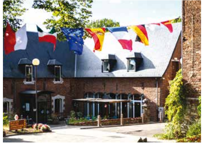
De feestelijk versierde entree naar de tuinen

Op de donderdagavond voorafgaand aan het concours is er voor de internationale jury een bijeenkomst in het Cultureel Centrum van Roeux, waar we al een glimp van het prachtige decor met gigantische bloemstukken kunnen opvangen. Voorafgaand aan het eten worden, onder luid applaus, vele van de gasten voorgesteld, afkomstig uit België, Duitsland, Frankrijk, Italië, Luxemburg, Nederland, Monaco, Tsjechië, Zwitserland, Spanje, Ierland en Polen. Zaak daarbij is wel de Franse taal enigszins te beheersen! Maar boven al is het een gezellig samenzijn met vrienden en veel bier, met liefde beschikbaar gesteld door de burgemeester en eigenaar van de brouwerij in Roeux.