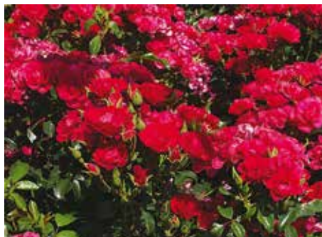
Afd. C, trosroos goud, R. Balou ('NOA20054'), Noack D