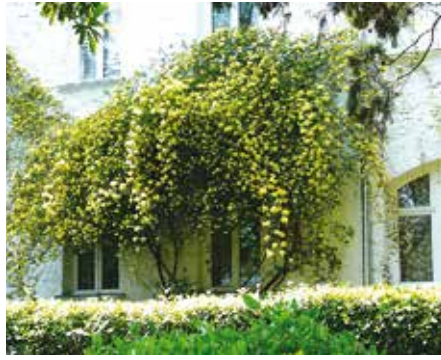
Rosa banksiae lutea groeiend tegen de datsja