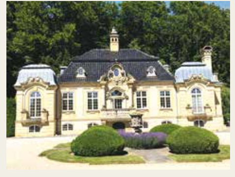
'Excillion' is gebouwd in de stijl van veel Franse kastelen

nen complex, en de Queen Louise's Rose Garden. Deze in de 19de eeuw aangelegde rozentuin was recentelijk gerestaureerd. Klein maar fijn.