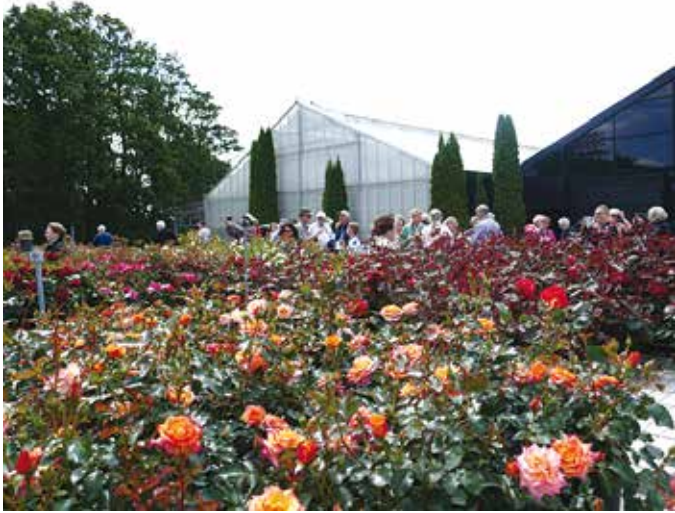
Foto 3. Poulsen Roses, Broby

landen. Dat betekent dat meer dan 50% van alle rozen, die wereldwijd verkocht worden Poulsen rozen zijn. Helaas kregen we geen toegang tot de "kraamkamers" van het bedrijf, wel konden we korte tijd een aantal testplanten die buiten stonden bekijken. Een beetje teleurstellend was dat toch wel!