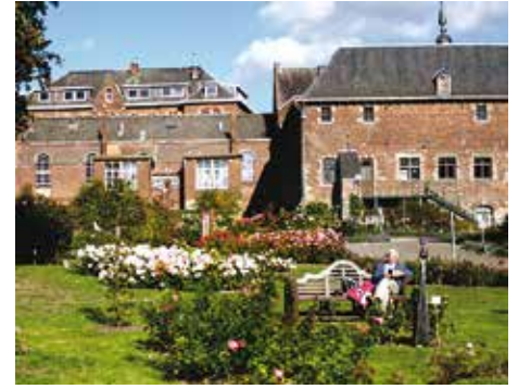
Na gedane arbeid is het goed rusten

de keuringen bij een kort miezerig buitje en was het genieten om tussen de rozen in de fraaie tuin, aangevuld met prachtige beeldende kunst, aan het werk te zijn. Het onderdeel geur leverde daarbij vaak nog het meeste werk op, door steeds diep door de knieën te moeten gaan om de enkele roos die er bij sommige struiken nog maar aan zat te kunnen besnuffelen. Gelukkig was er bij een groot aantal daarvan wel geur te ontdekken, met enkele bijzondere uitschieters, zoals later bij de uitslagen ook zal blijken.