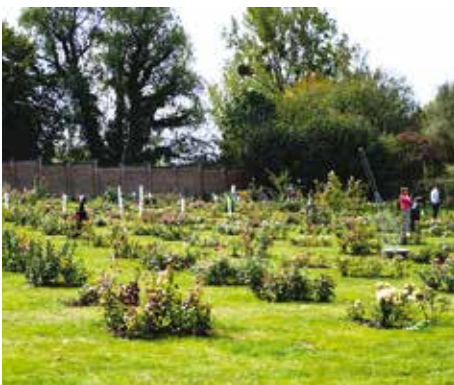
Overzicht van een deel van de tuinen

Door de lange droge zomer was het een uitdaging voor zowel de rozen, als de kwekers en werd er door middel van een bijzonder fraai -in drie talen voorgedragen- gedicht aandacht en begrip gevraagd voor het feit dat wellicht niet alle rozen er nu op hun best bij zouden staan. De nacht voor het concours had het flink geregend en op de dag zelf was het de vraag of we het wel droog zouden houden. Gelukkig bleef het tijdens