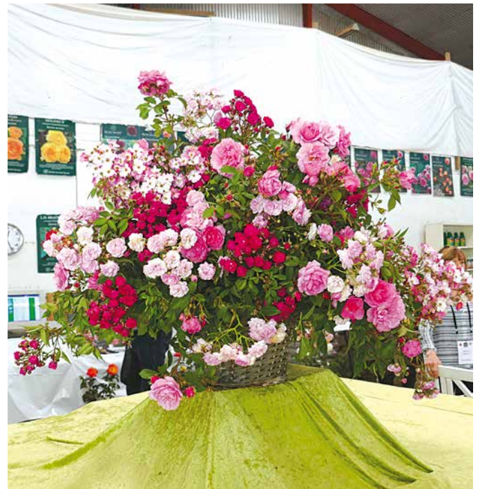
Foto 21. Rozenbloemstuk bij kwekerij Rosenposten van Knud Pedersen