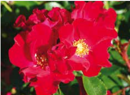
Afd. A, heesterroos certificaat 1 e klasse, R. 'r-07-0155-003', Boot & De Ruiter NL