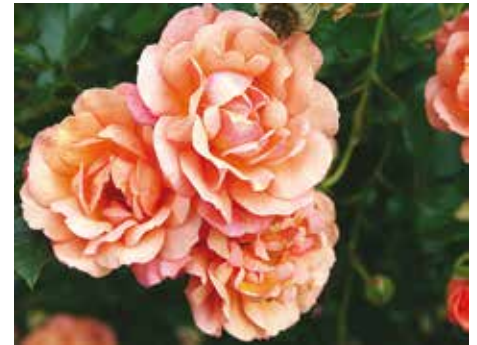
Afd. C, heesterroos zilver, R. Lambada ('KORapfhecki'), Kordes D

De Achterhof zag er beter uit na de renovatie in het voorjaar; dit najaar gaat de Middenhof op de schop. Tot slot, mijn complimenten voor de hele hoveniersploeg die begonnen in een ronduit koud voorjaar om te eindigen in een hittegolf.