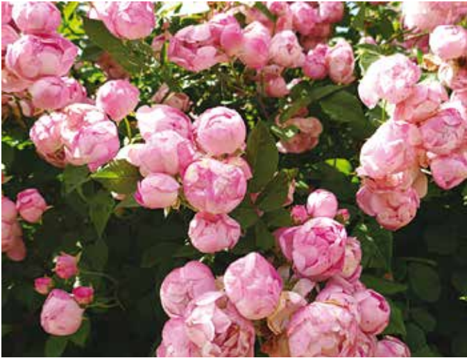
Foto 8. Rosa macrantha 'Raubritter', Kordes 1936