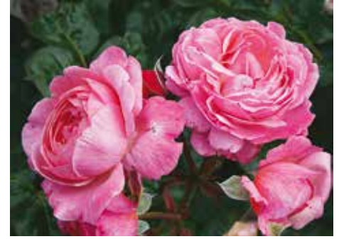
Afd. C, heesterroos goud, R. Kölner Flora ('KORMahensi'), Kordes D