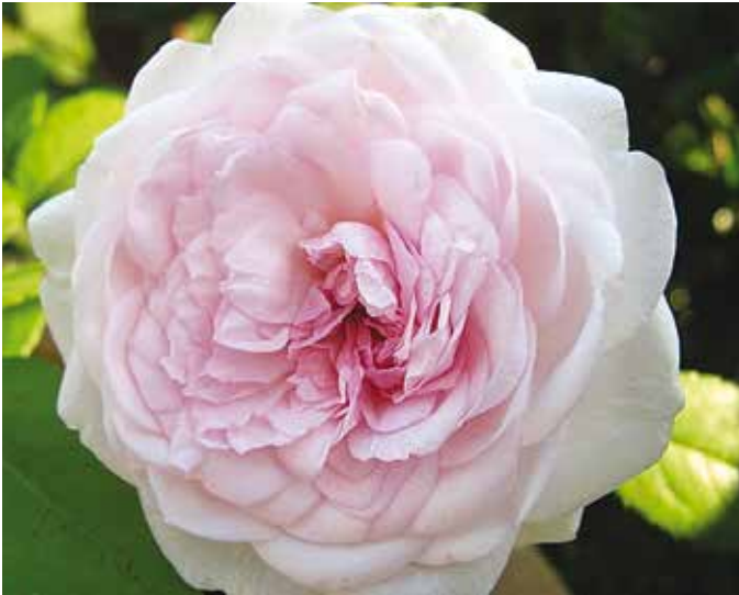
R. 'Clothilde Soupert', polyantha roos, Soupert & Notting 1888