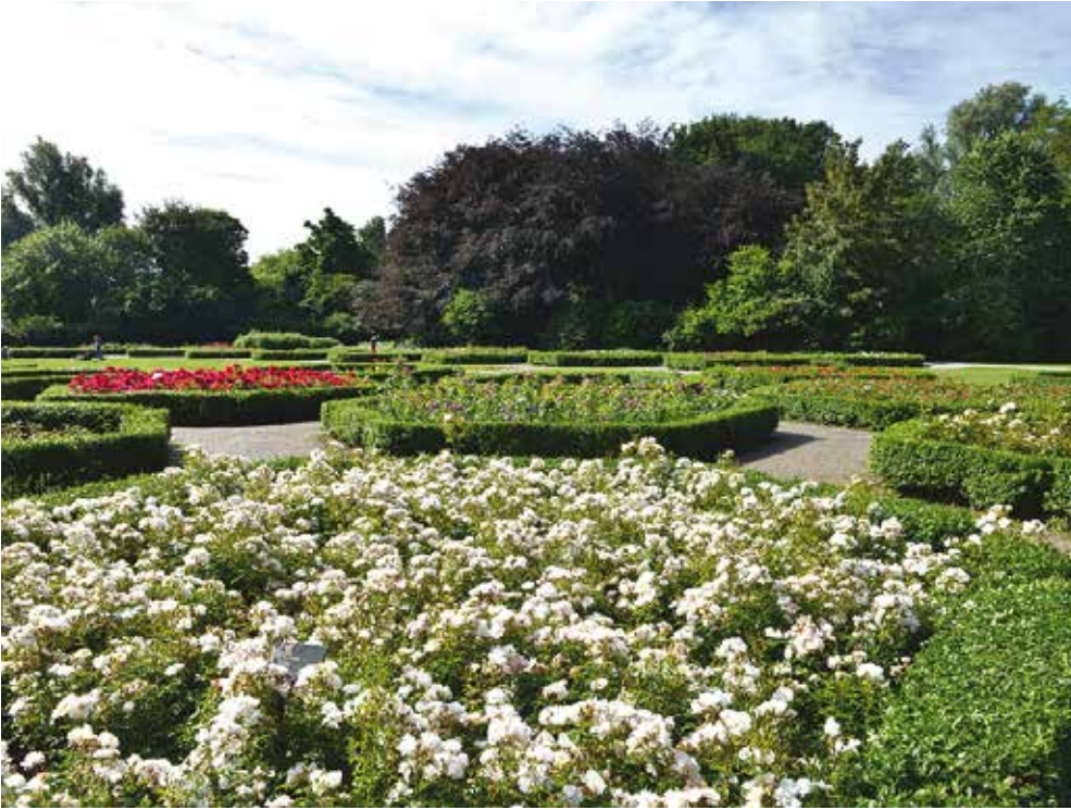
R. 'Diamant' (Kordes)