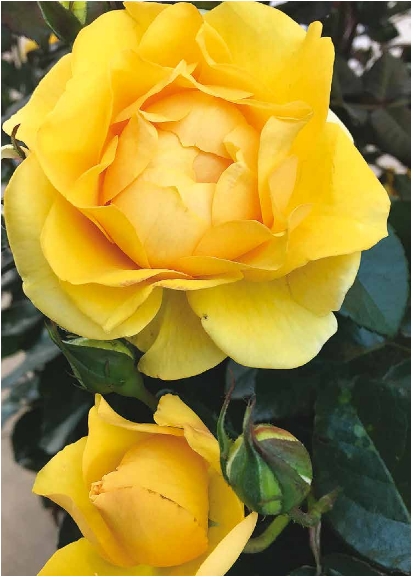
Roos ter ere van het 50-jarig jubileum van de WFRS: R. 'Friendship Forever', Eskelund DK