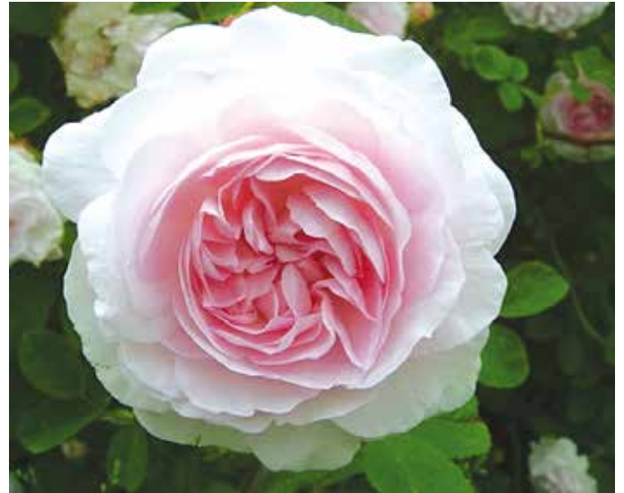
R. 'Chloris', alba, Descemet vóór 1815