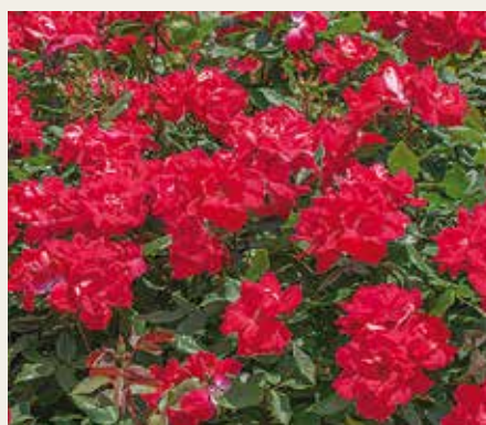
R. 'Knock Out' van Bill Radler werd gekozen in de Hall of Fame, moderne rozen