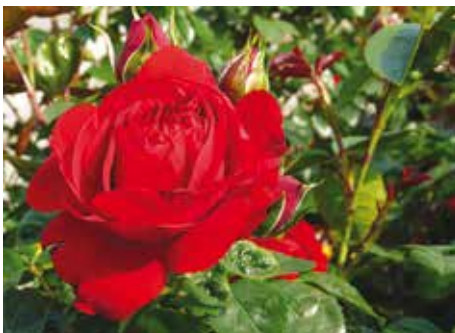
Afd. C, leiroos goud, R. Florentina ('KORtrameilo'), Kordes D