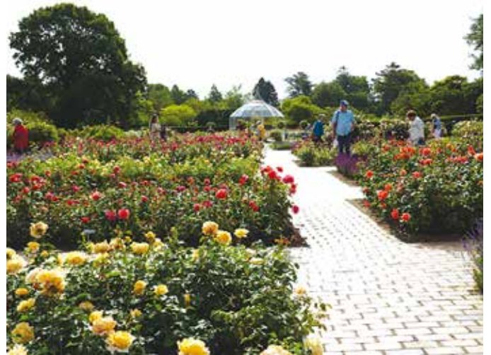
Foto 15. Rozentuin Geografisk Have, Kolding

lectie historische rozen, die de koningin in het midden van de jaren 70 had gekregen alsmede een collectie sculpturen. Deze waren voor een groot deel door de in het voorjaar overleden prins Henrik ontworpen, die net als koningin Margrethe heel artistiek was. (foto 22) Deze laatste nacht van de tour sliepen we in het centrum van Aarhus , waar we op eigen gelegenheid de stad nog een beetje konden verkennen. Aarhus heeft een gezellig historisch centrum, Den Gamble By, met veel verschillende restaurants en terrasjes.