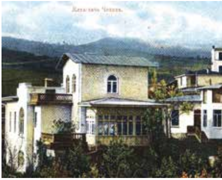
De 'Belaya datsja' (witte cottage) op een oude ansichtkaart