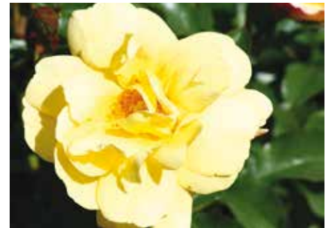
Afd. C, heesterroos brons, R. Candela ('RT08-273'), Tantau D