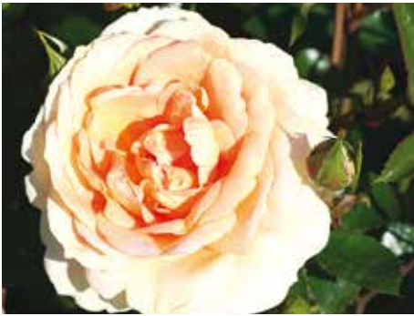
Afd. A, trosroos certificaat 2 e klasse, R. 'KO 07/3175-01', Kordes D