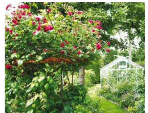
Foto 7. Rozenstandaard met wilgentenen rand