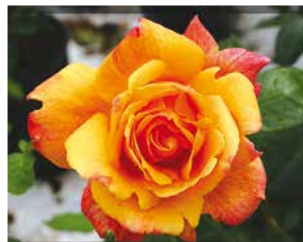
R. 'Sutter's Gold', grootbloemige roos, Swim 1950