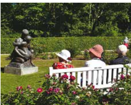
Foto 22. Rozentuin bij Marselisborg Palace