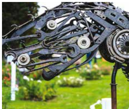
Eén van de kunstwerken in de tuinen