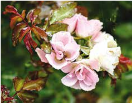
Certificaat van verdienste voor 'KO07/2102-01', trosroos, Kordes

(Nederland), KO 07/2102-01, een zachtroze trosroos van Kordes, KSX 341, een lichtroze trosroos van Shunsuke Takeuchi, Japan en Lake Como, een oranje trosroos van Rose Barni, Italië.