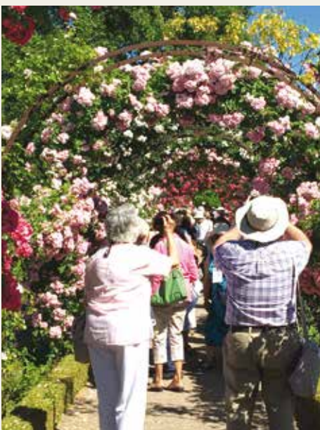
De rozentuin bij paleis Fredensborg

We begonnen met een bezoek aan het koninklijk paleis Fredensborg, het zomerverblijf van de koningin. De meesten onder ons begaven zich eerst naar de rozentuin. Er waren oude rozen aangeplant, zoals een bourbonroos van Guillot R. 'Baron J.B. Gonella', maar ook moderne zoals R. Charlotte ('AUSpoly') van David Austin. Het bezoek werd afgesloten met wederom een rozendoop, de R. 'Prins Henrik', ter nagedachtenis aan Prins Hendrik die begin dit jaar is overleden. Hij heeft deze roos van Rosa Eskelund nog wel zelf kunnen uitkiezen.