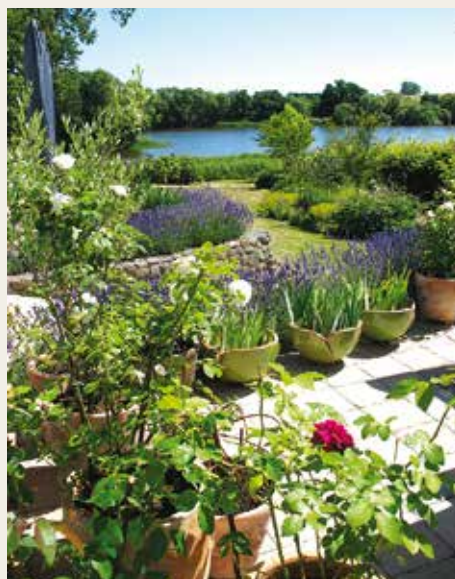
Tuin 'Kornerupgaard' gelegen aan het Kornerup meer