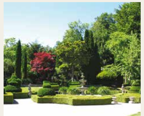
Het park van 'Excillion'