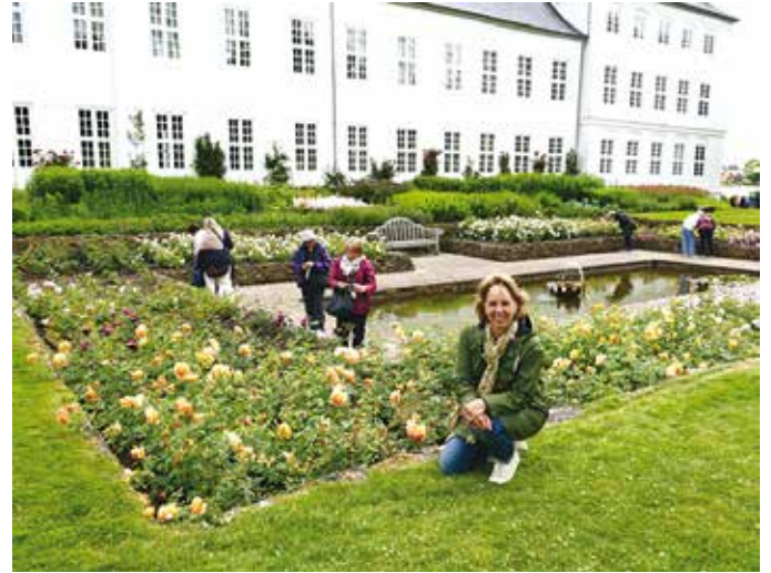
Foto 9. Verdiepte rozentuin Gråsten Slot

honingcake, die al net zolang bestaat als Christiansfeld zelf. Overnachting en diner in het mooi aan het water gelegen hotel Koldingfjord in Kolding. 's Avonds was er op het strandje voor het hotel een groot vreugdevuur vanwege het Midzomerfeest, ook wel "Sankt Hans aften" genoemd.