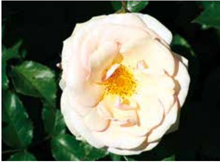
Afd. C, trosroos brons, R. Sweet Honey ('KORmecaso'), Kordes D