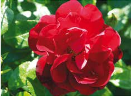
Afd. A, trosroos goud, R. 'KO 07/2940-01', Kordes D