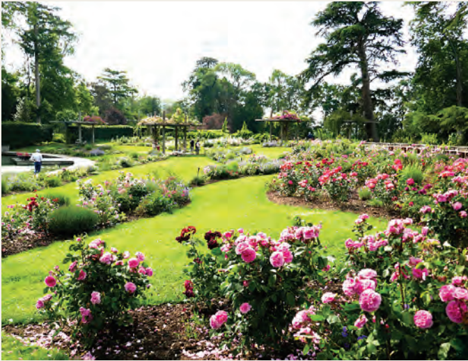
Parc Floral de la Source