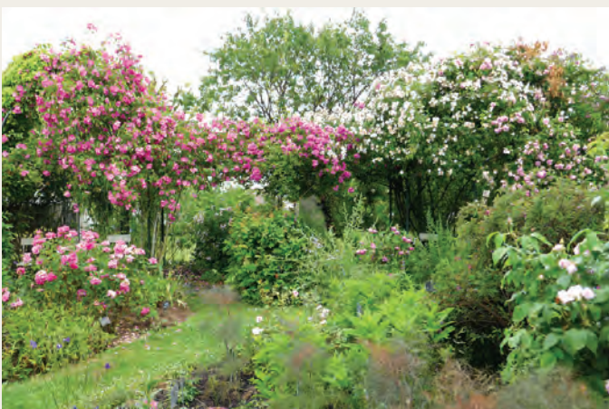
Jardin de Morailles

dan anders, maar door de meesten wel gewaardeerd. Daarna vertrekken we naar Château de Chamerolles , waar we de geschiedenis van het toilet en de parfum gaan ontdekken. Niet ver van het kasteel staan grote cosmeticabedrijven als Shiseido en Dior, die de aanwezigheid van dit thema verklaren. Na een leuke rondleiding kunnen we nog een kijkje nemen in de