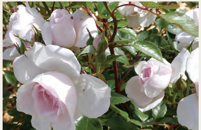
R. 'Jardin de Granville', Eve 2010