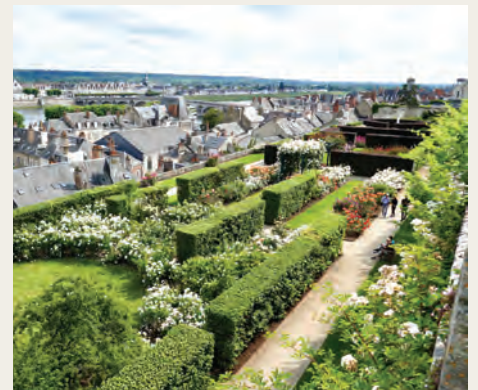
Roseraie de Blois