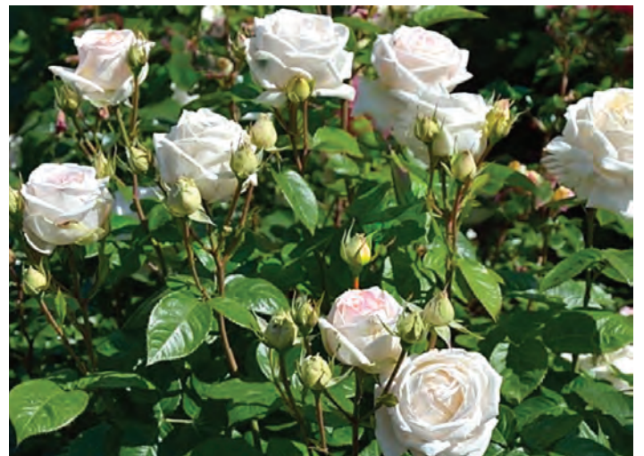
Afd. C grootbloemige rozen Goud R. Madame Anisette ('KORberonem'), Kordes D