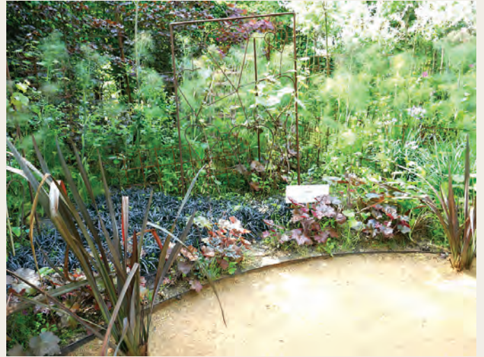
Kasteel Chaumont-sur-Loire; festivaltuin