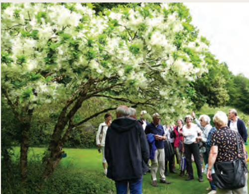
Jardin du Plessis; Chionanthus virginicus