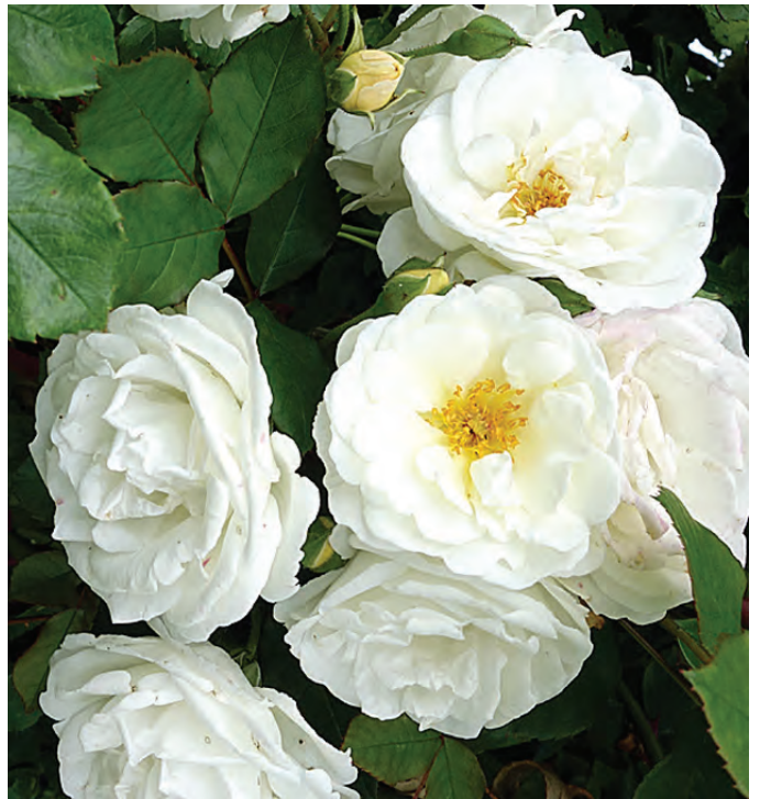
Gouden Roos en Publieksprijs: R. Perfume Dreams ('VISechdam'), leiros, Vissers B

Deze leiros heeft perzikoranje zeer elegante vlinderachtige grote bloemen. De fantastische geur is moeilijk te omschrijven. Kortom een fascinerende roos. Deze roos heeft misschien de pech gehad dat hij ingesloten tussen andere rozen in de Leirosenhof staat, terwijl de Gouden Roos solitair op het gras staat te pronken.