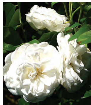
Afd. C trosrozen Brons R. Prague ('POULcas043'), Poulsen DE