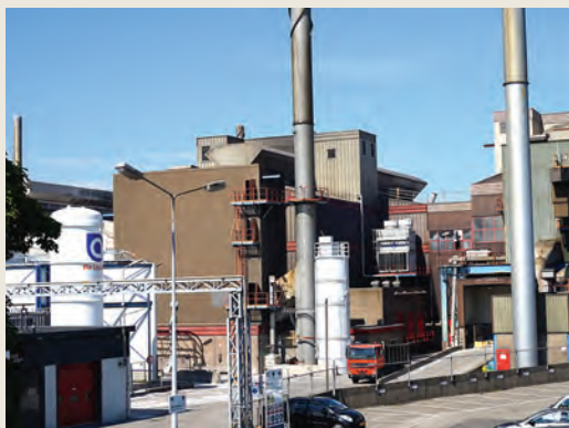
Royal Leerdam Crystal

Nat. Glasmuseum Lingedijk 28-30 4142 LD Leerdam www.nationaalglasmuseum.nl