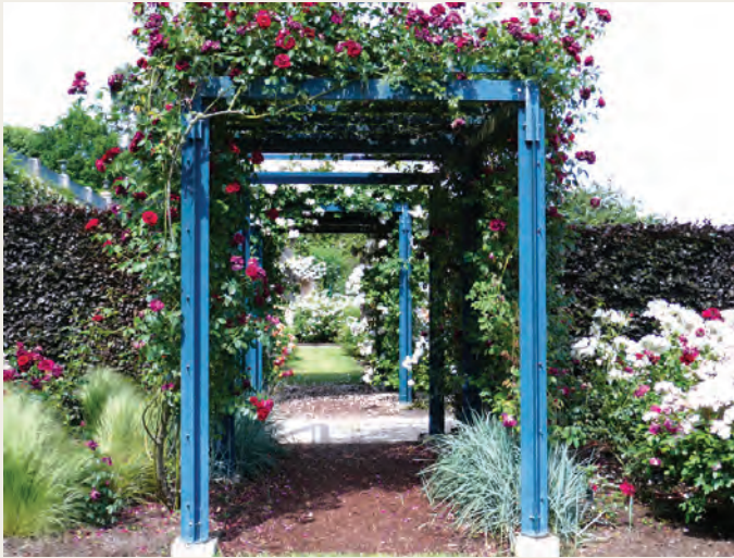
Roseraie de Blois