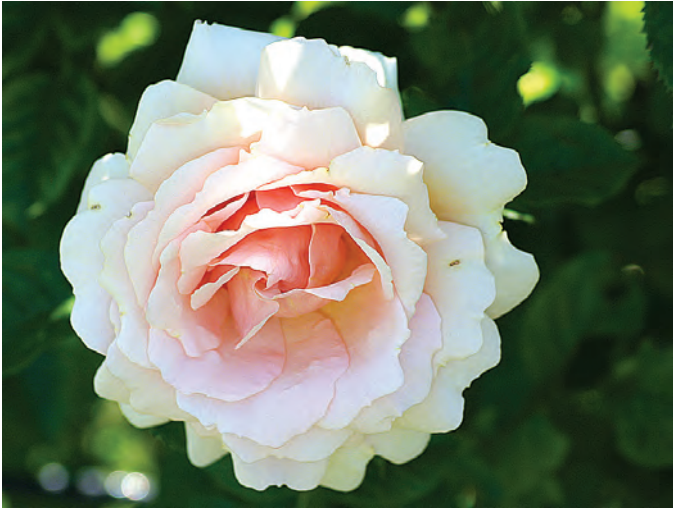
Afd. A leirozen Cert. 2 e kl. R. 'CHEwhyteach', Warner UK