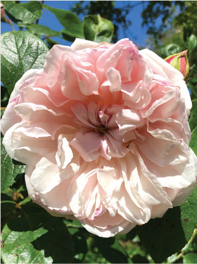
R. The Generous Gardener ('AUSdawn'), Austin