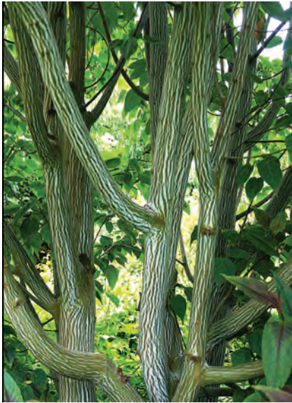
Nieuw Robbenkampen. Grijs streepjesbast esdoorn ( Acer rufinerve )