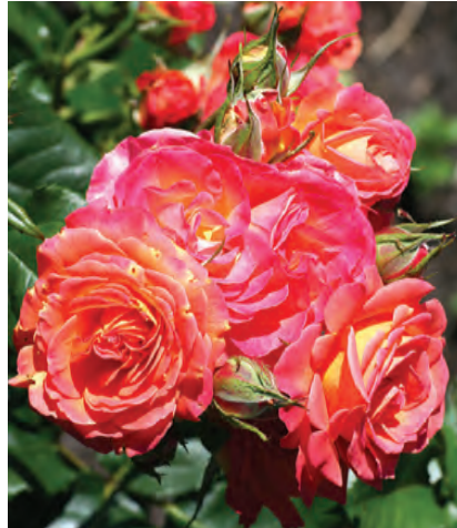
Afd. A trosrozen Cert. 2° kl. R. 'Vulcano', Kordes D