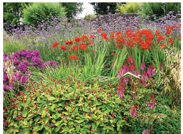
De Tuinen van Appeltern. Border in felle kleuren