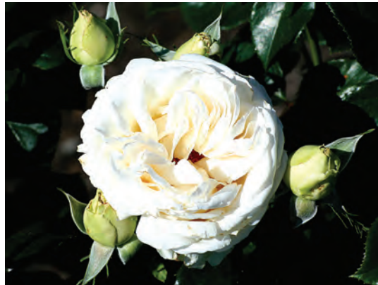
Afd. A grootbloemige rozen Cert. 1° kl. Kordes D