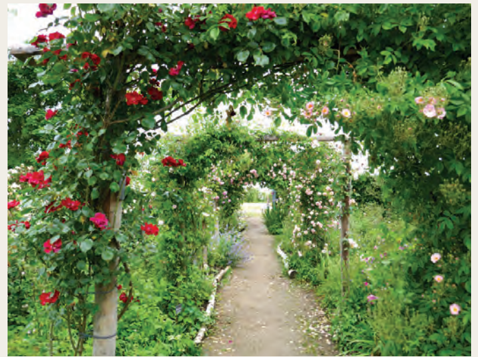
Jardin de Morailles

ten constructies gebouwd, waarop ze welig kunnen tieren en een schaduwdek bieden voor de bezoekers. Een prachtig park om in rond te dwalen.