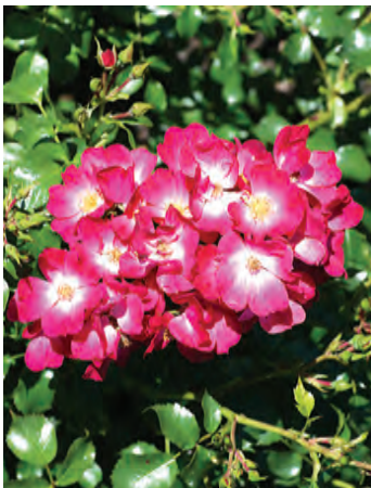
Afd. A heesterrozen Goud R. 'LAKsomroz', Lakei NL