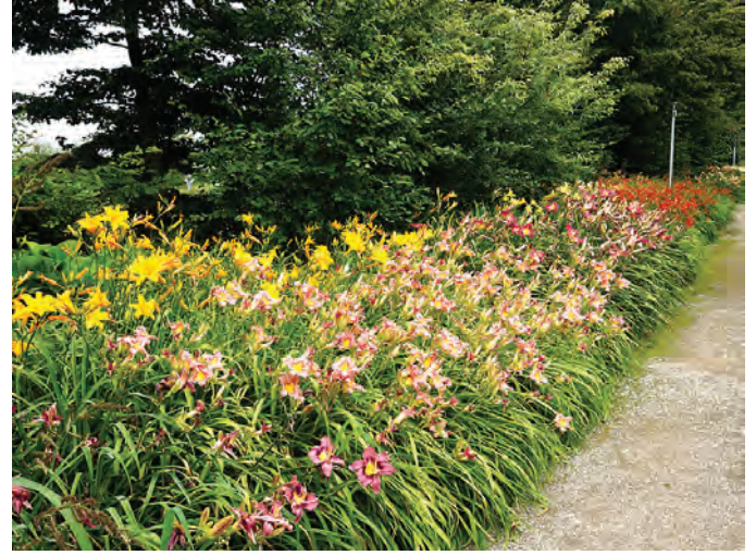
De Tuinen van Appeltern. Laan met Hemerocalissen

gewoon liggen) en ik kan u zeggen dat de vijvers helder als kristal zijn en waar de vele waterlelies het erg naar hun zin hebben. De tuin is groot, 15.000 m 2 is zomaar niet in een paar uurtjes bekeken en mocht u in de gelegenheid zijn deze prachtige tuin te bezoeken, trek dan maar rustig de hele dag uit, want door de meanderende vorm ligt achter elke bocht een ander verrassend uitzicht. Graag hadden we wat langer in deze prachtige tuin willen blijven maar we moesten op weg naar De Tuinen van Appeltern.