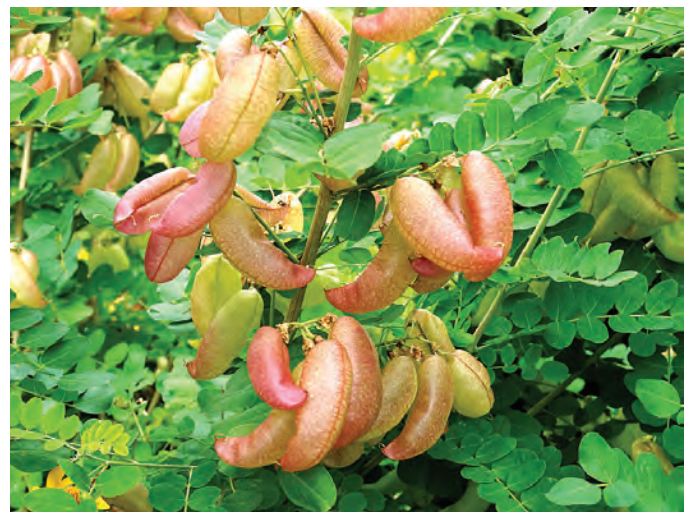
Nieuw Robbenkampen. Blazenstruik ( Colutea arborescens )

erg lang, ongeveer zestien A4tjes. Dendrologen kunnen hier hun hart ophalen maar ook wij, leden van de Nederlandse Rozenvereniging, keken onze ogen uit. Ik raad u aan om een kijkje te nemen op www.nieuw-robbekampen.nl .