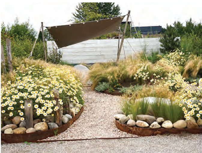
De Tuinen van Appeltern. Woestijntuin

Water is een natuurlijke bron van leven en is in deze tuin aanwezig in de vorm van drie grote vijvers. Zo af en toe worden in het voorjaar wat waterplanten weggehaald (ook dat blijft