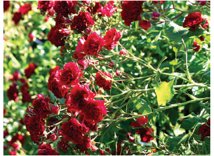
Afd. A leirozen Cert. 2 e kl. Kordes D