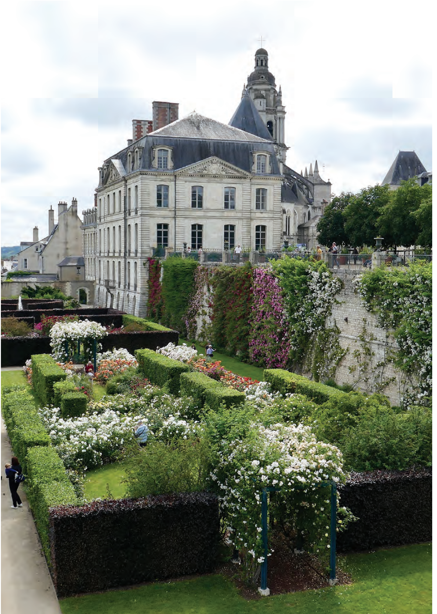
Roseaie de Blois