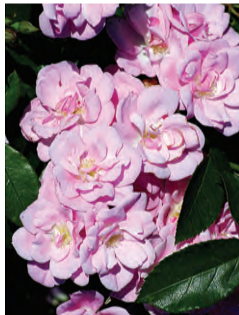
Afd. A heesterrozen Cert. 2° kl. Meiland F