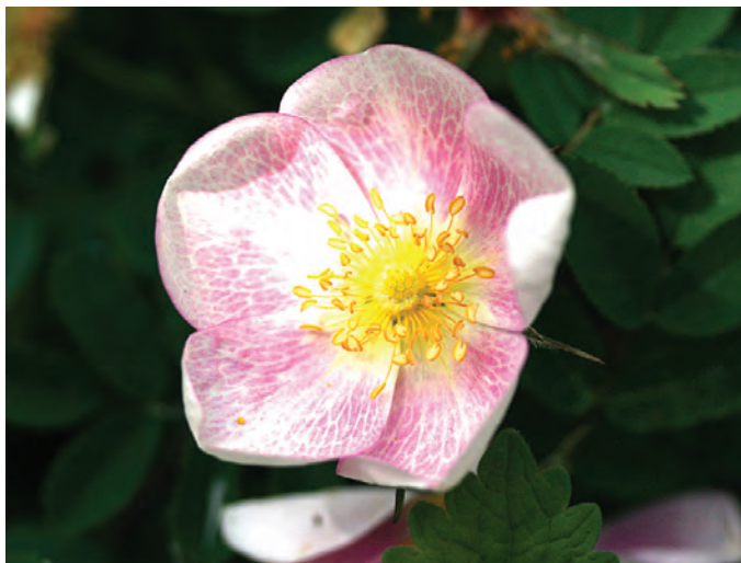
R. 'Nellyn Tytär', spinosissima hybride

Haar man Ilmari Rautio heeft zelf helaas geen verstand van rozen, hij was in hun tuin alleen maar met slavenarbeid bezig grapt hij, maar de rozentuin vormt voor hem een grote inspiratie voor zijn eigen, abstracte schilderijen. Sommige schilderijen zijn warm van kleur, anderen juist koud, maar bij allemaal lijkt de verf te kolken, haast tot leven te komen. Een van zijn schilderijen heet vrij vertaald 'verdriet'. Als toelichting staat er bij dat het gaat over een snoek in het water op een grijze maandagochtend, als een noordenwind koude golven met zich meebrengt. Dat vind ik nou leuk, om zo'n toelichting bij dit schilderij te lezen. Ik zie dat niet als uitleg, maar eerder als een gedicht dat de kijker meeneemt in de diepte van dit werk. Op facebook vind ik nog een foto die me aanspreekt: een van zijn werken op een schildersezel in een graanakker met goudgele