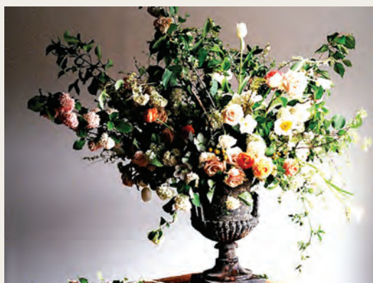
Bloemarrangement van Constance