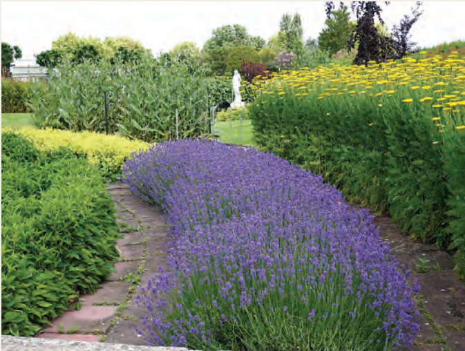
Lavendel en Achillea in de tuin van fam. Van der Hoorn

De ontvangst was allerhartelijkst, de heer en mevrouw Van den Hoorn zijn enthousiaste mensen die iedere dag met toewijzing in hun tuin bezig zijn. De tuin is ca. 1 ha. groot en er is een gedeelte van een kas bewaard gebleven; de beplanting is door de heer en mevrouw Van der Hoorn zelf gedaan. Langs het betonnen pad links in de tuin zijn moerbeibomen geplant,