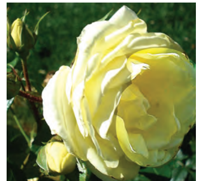
Afd. C grootbloemige rozen Brons R. Limona ('KORmonali'), Kordes D