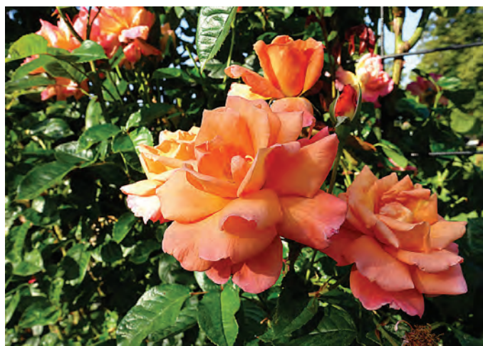
Geurprijs: R. Scent from Heaven ('CHEwbabaluv'), leiros, Warner UK