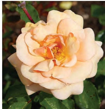
Afd. C trosrozen Zilver R. Sweet Honey ('KORmecaso'), Kordes D