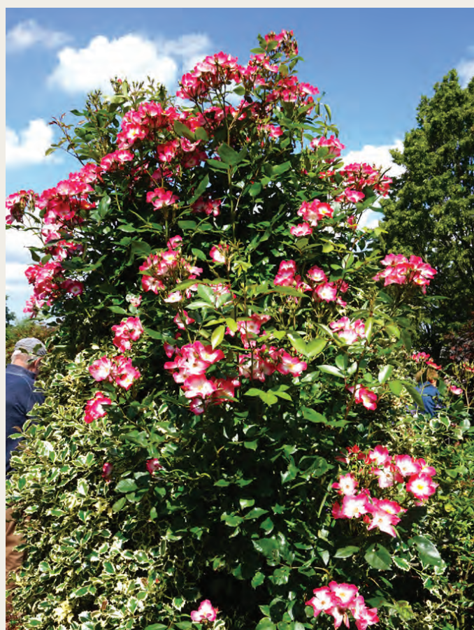
In de rozentuin