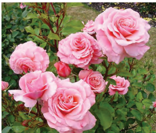
R. Sexy Rexy ('MACrexy'), trosroos 1978