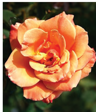
R. Spek's Centennial ('MACivy'), trosroos, ter gelegenheid van het 100 jarig bestaan van Jan Spek Rozen