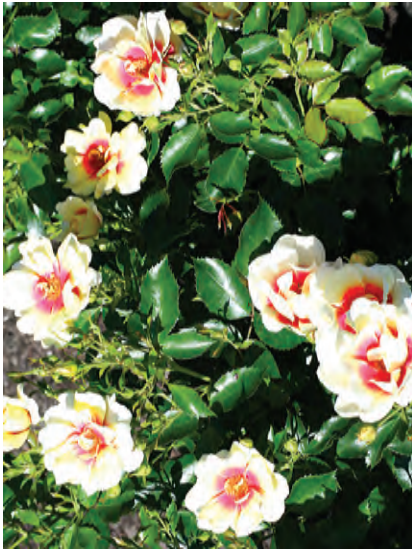
Afd. A trosrozen Cert. 1° kl. R. 'Glorious Babylon Eyes', Interplant NL