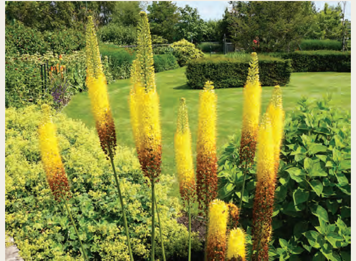
Eremurus en Alchemilla mollis in de tuin van fam. Van der Hoorn

De ontvangst was allerhartelijkst, de heer en mevrouw Van den Hoorn zijn enthousiaste mensen die iedere dag met toewijzing in hun tuin bezig zijn. De tuin is ca. 1 ha. groot en er is een gedeelte van een kas bewaard gebleven; de beplanting is door de heer en mevrouw Van der Hoorn zelf gedaan. Langs het betonnen pad links in de tuin zijn moerbeibomen geplant,