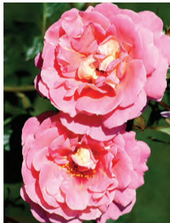
Afd. A heesterrozen Cert. 1° kl. R. 'CHEweyesokme', Warner UK