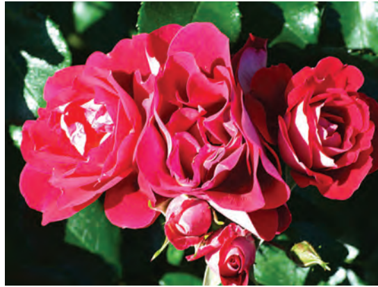
Afd. A trosrozen Cert. 2° kl. R. 'Caracho', Kordes D

Brons: R. Prague ('POUlcas043'), trossen met witte gevulde bloemen met een crème hart.