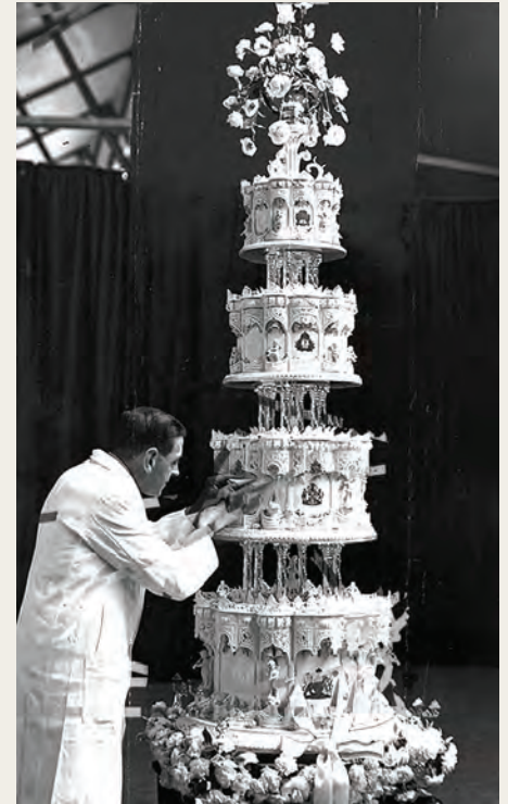
Bloemdecoraties van Constance op de bruidstaart bij het huwelijk van prinses Elizabeth met prins Philip