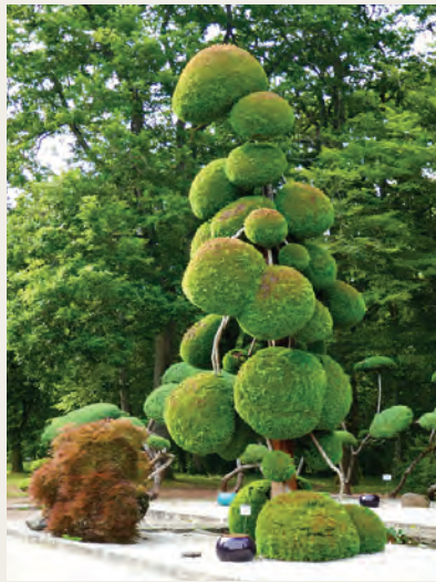
De buxustuin in Parc Floral de la Source