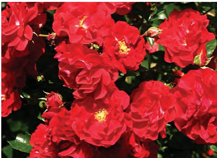
Afd. C patiorozen Goud R. Salsa ('RT 08-333'), Tantau D