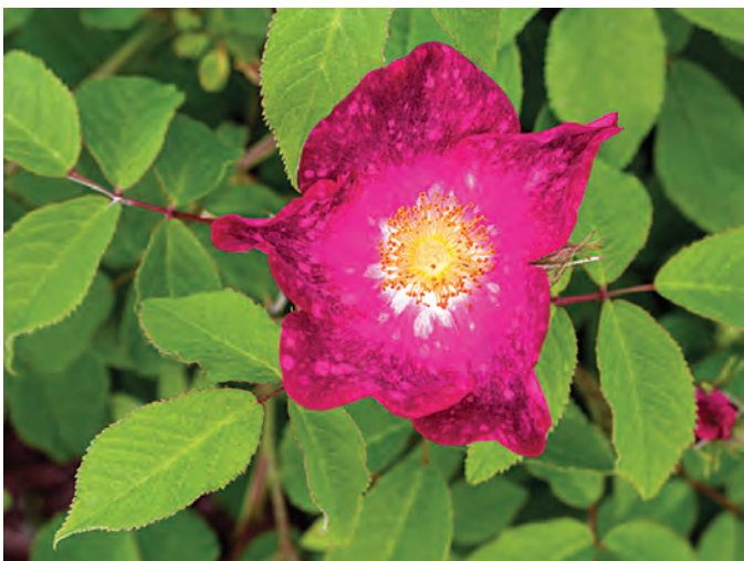
R. 'Asta', gallica