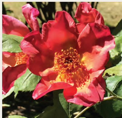
R. Fighting Teneraire ('AUSrava'), Austin