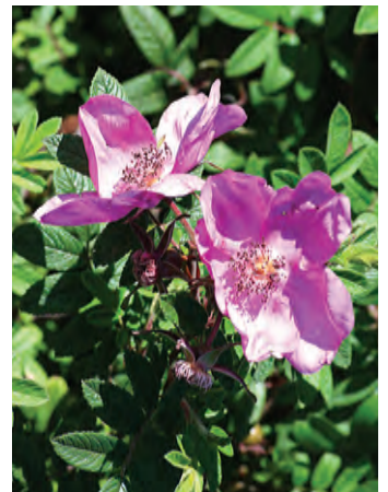
Afd. A heesterrozen Cert. 2° kl. Boot & de Ruiter NL