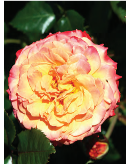
Afd. A trosrozen Cert. 1° kl. Kordes D