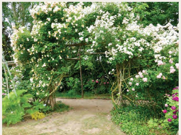
Jardin de Roquelin