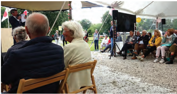
Prijsuitreiking in de tent in het Westbroekpark