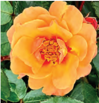
Afd. C trosrozen Goud R. Persian Sun ('VISpersun'), Vissers B