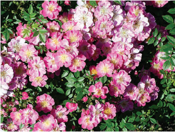
Afd. A patiorozen Cert. 2 e kl. R. 'VISpanicov', Vissers B