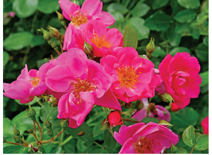
Afd. C patiozozen Brons R. Syra ('RT 9-404'), Tantau D