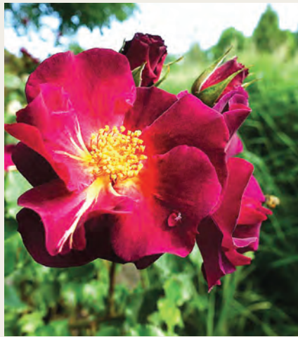
R. Wild Rover ('DIChirap'), trosroos 2007; Colin Dickson