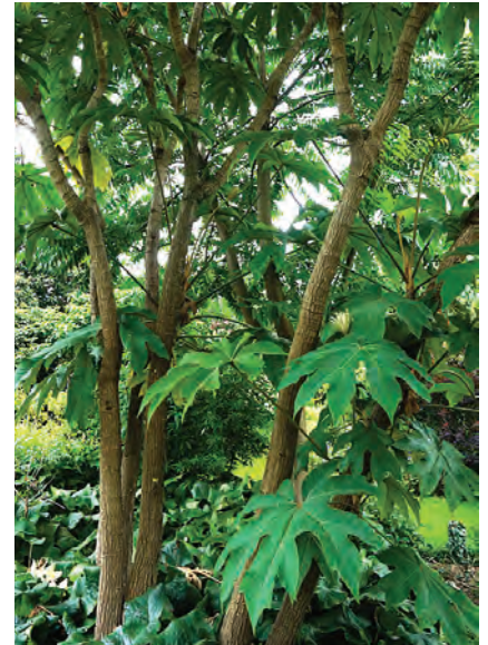
Nieuw Robbenkampen. Rijstpapierplant ( Tetrapanax papyrifer 'Rex' )