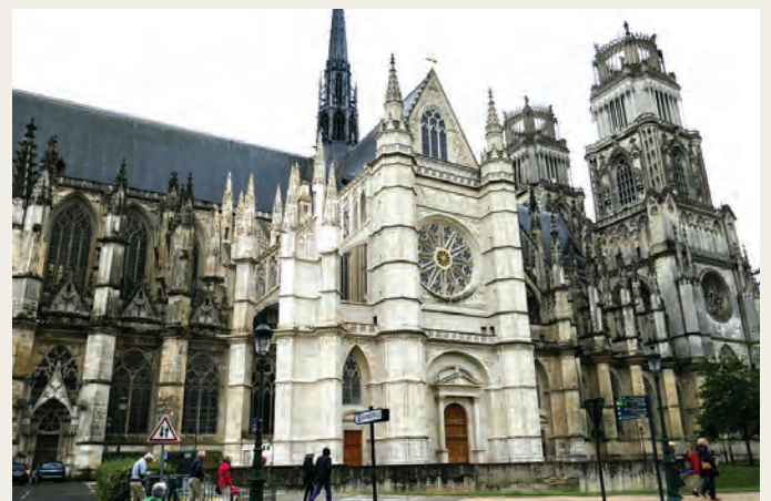
Saint-Croix kathedraal in Orléans