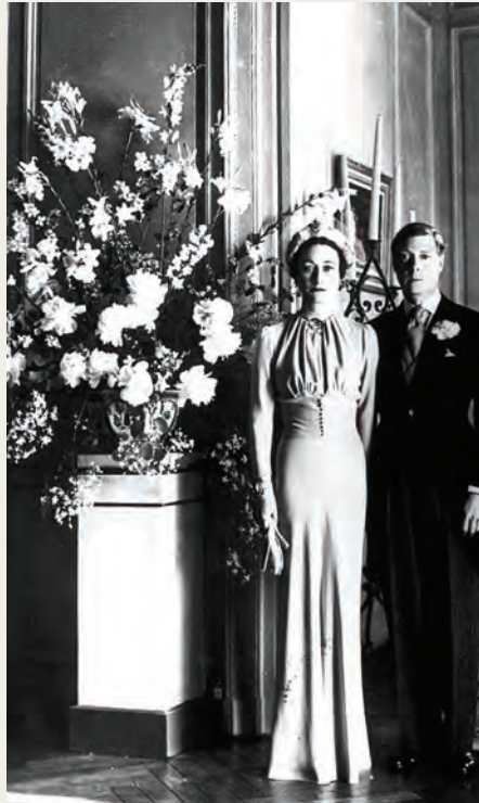
Boeket gemaakt door Constance bij het huwelijk van de Duke of Windsor met Wallis Simpson