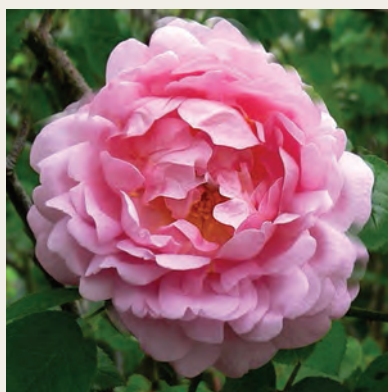
R. Constance Spry ('AUStance')

In de twintiger jaren kreeg Conny de kans om hoofd te worden van een experimentele school voor vervolgonderwijs in het arme oostelijk deel van Londen om kinderen 'klaar te maken voor het leven'. Het lesprogramma was zeer veelzijdig, de klassen waren klein en ze mocht zelf haar collega's opleiden. Heerlijk vond ze dat en elke week nam ze armen vol bloemen mee naar school om de lokalen op te fleuren. Haar school was zeer succesvol, maar door gebrek aan geld kon de overheid dit soort scholen niet voortzetten. Voor de partijen van vrienden en kennissen maakte Constance tussen alle bedrijven door