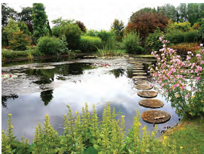
Nieuw Robbenkampen. Vijver met lelies en stapstenen

Om 10 uur zaten we aan de koffie bij Jan van Egmond in Dreumel. Jan heette ons welkom en nam ons mee de tuin in. De aanleg van deze tuin begon in 2012 en beslaat een oppervlakte van 15.000 m 2 ; de lijst van vaste planten, heesters en bomen is