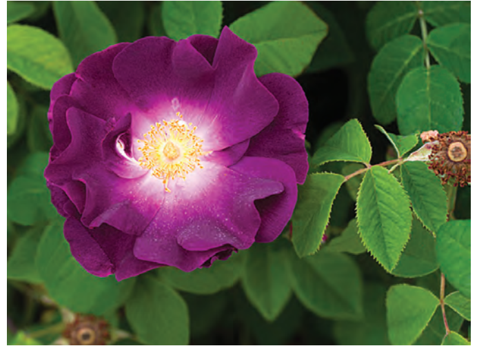
R. 'Merveille', gallica

stoppels. Schilderij en landschap die elkaar versterken.