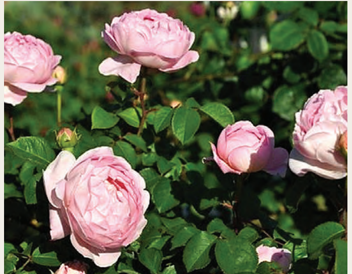
R. Constance Spry ('AUSstance')