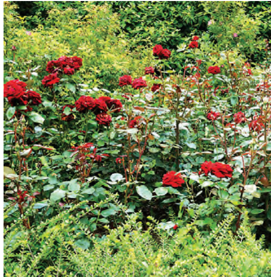
Nieuw Robbenkampen. R. 'Ingrid Bergman'