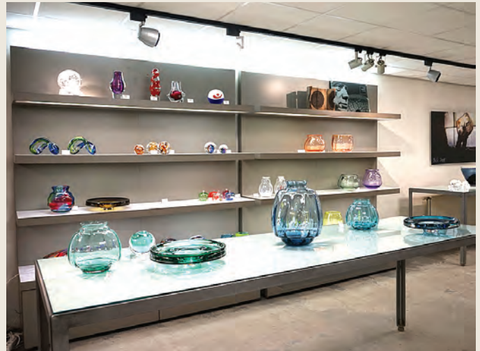
Kristalwinkel in Leerdam

Na de rondleiding en de lunch kunt u op eigen gelegenheid ook het Nationaal Glasmuseum bezoeken dat ook aan de Lingedijk ligt en vanaf het parkeerterrein eenvoudig te bereiken is. Voor glasliefhebbers is dit museum een must want er is heel veel te zien. Hier zijn vele objecten tentoongesteld van kunstenaars die bij Royal Leerdam het vak hebben geleerd, zoals Floris Meijdam en Andries Copier. Een aanrader!