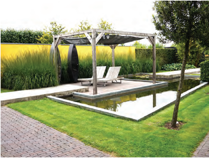
De Tuinen van Appeltern. Onderhoudsvrije tuin