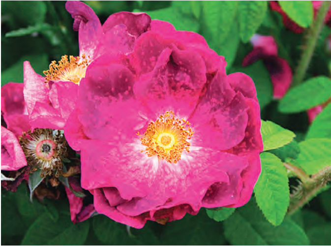
R. 'Charles Baudelaire'

Mochten mensen een roos onder de naam 'Inis' hebben aangeschaft, dan gaat het om dezelfde roos. Buiten Finland zijn er niet zoveel mensen die het Fins beheersen. De naamlabels zijn inmiddels al gecorrigeerd.