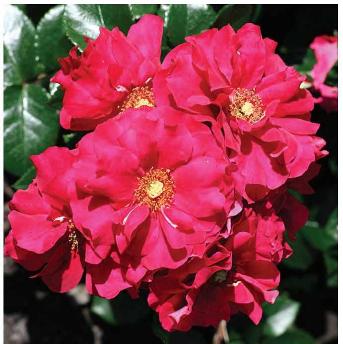
Afd. A trosrozen Goud R. ('DICmars'), Dickson N. Ireland