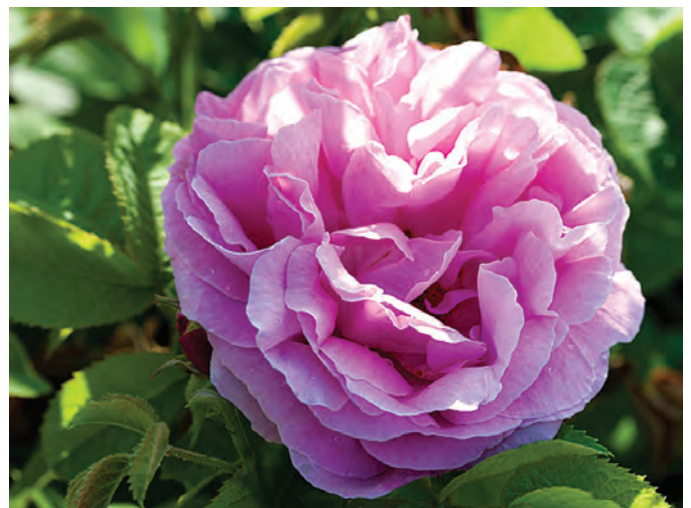
R. 'Auli', gallica