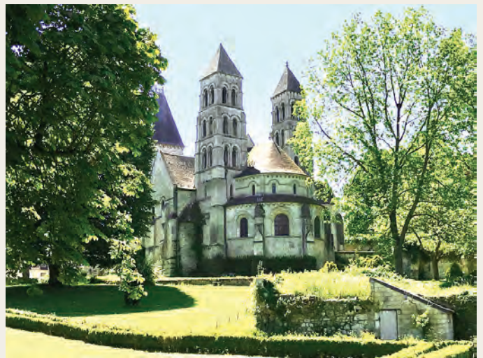
Abdy in Morierval