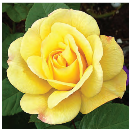
R. 'Arthur Bell', trosroos 1959