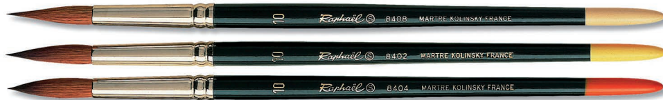
Drie penseelvormen van Raphaël® met de nummers 8408, 8402 en 8404. Dik van 16 naar 0 en fijner tot 4/0.

Voor het maken van een botanisch aquarel gebruik je een klein penseel die rond en puntig is. Penselen hebben een nummer dat enig houvast geeft, maar er zijn best verschillen bij merken zoals die van Daler-Rowney, Da Vinci, Winsor & Newton, Talens of Raphaël. Een type met Kolinsky-haar voldoet uitstekend, is veerkrachtig met mooie punt. Basispenseel met nummer 2 en 3 en kleiner 1 of 0 of nog kleiner. Na het uitwassen ook eens met reinigingszeep erbij of met penseelreiniger.