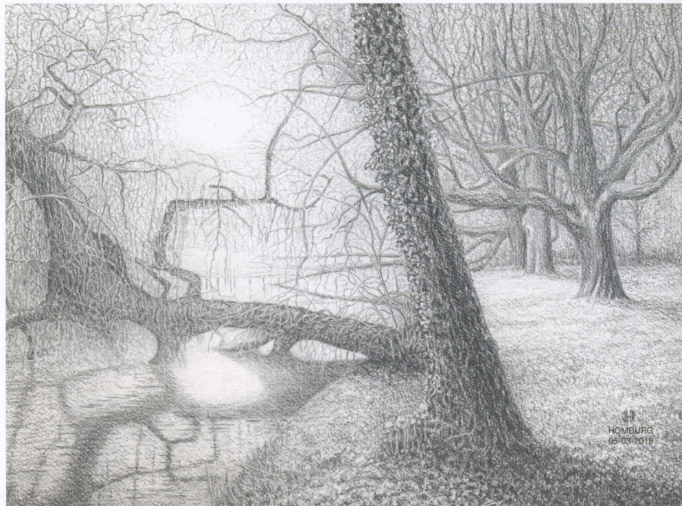
Gewone els in het Vondelpark Amsterdam - lage zonnestand - winter 2018 - met PROGRESSO HB t/m 4B Papier: Arches Watercolour / Gold Pressed / 185 g/m 2 / 26 x 36 cm / 100% cotton. Hans Homburg

Let op het karakter van bomen, de schors van de stam, groeiwijze van takken en de vorm van de bladeren. In de winter veel takken en daarna vooral veel bladeren. Breng sfeer in het landschap met zachte tonen, hooglicht en schaduw of met mooie luchten door tijdige invulling met grafietpoeder in combinatie met vlakgum. Noteer de naam van de boom, bomen of begroeiing, waar het is en de datum. Maak een foto als referentie of aantekeningen als je later thuis verder gaat tekenen.