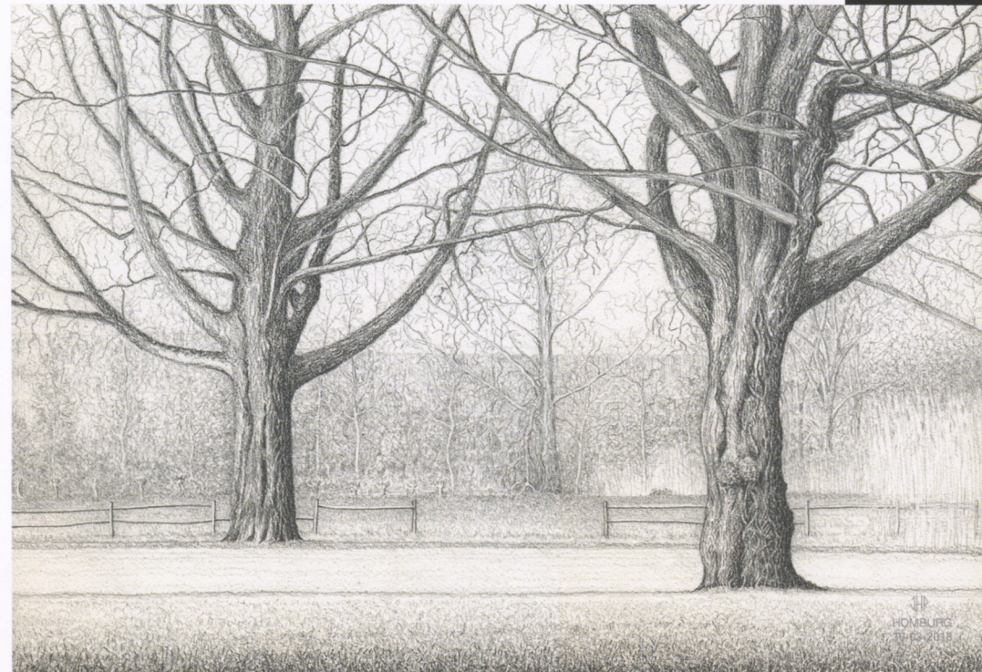
Gewone vleugelnoten in het Vondelpark Amsterdam - lente 2018 - met PROGRESSO HB t/m 4B Papier: Arches Watercolour / Gold Pressed / 185 g/m 2 / 26 x 36 cm / 100% cotton. Hans Homburg

Zaterdag 2 juni 2018 van 14-16 uur door Hans Homburg